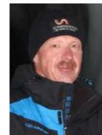
Lieber Leserinnen und Leser,

Krisen gibt es auch im Wintersport - wenn der Schnee ausbleibt. Wenn der Schnee kommt, dann geht's rund. Wenn nicht - geht's trotzdem - mit der Schneestation!